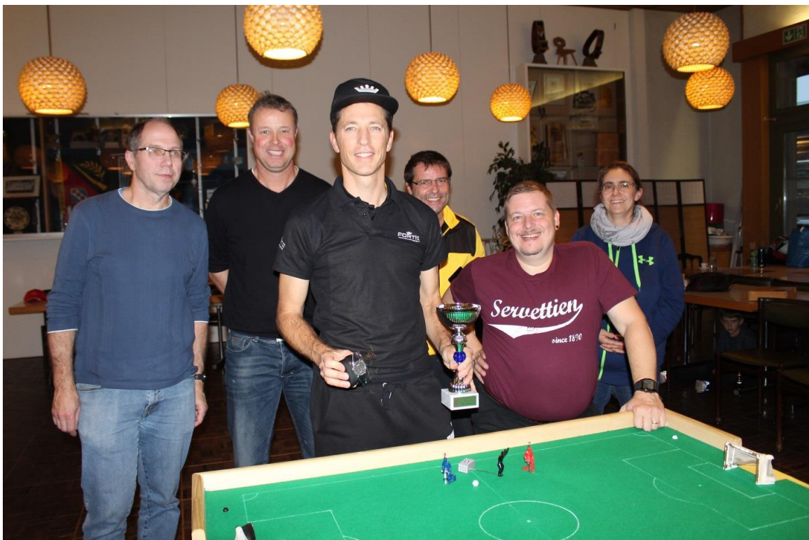
Der Karl-Mayer-Cup 2018 war trotz der geringen Teilnehmerzahl ein schönes Turnier. Diesbezüglich waren sich alle Teilnehmer einig. Hoffentlich beteiligen sich im kommenden Jahr mehr Tipp-Kick-Freunde am traditionellen Einzelturnier des TKC Mutz Bern!